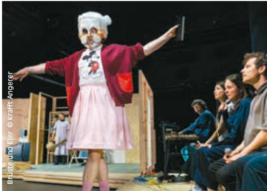
Brüste und Eier