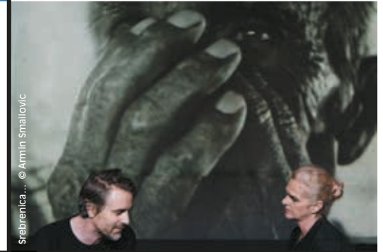
Srebrenica...