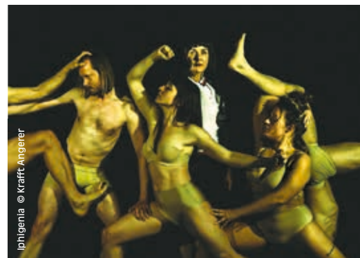
Iphigenia