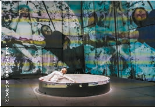
(R)Evolution © Krafft Angerer