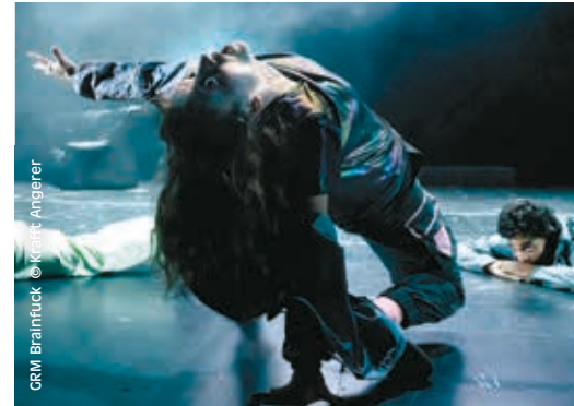
GRM Brainfuck © Krafft Angerer