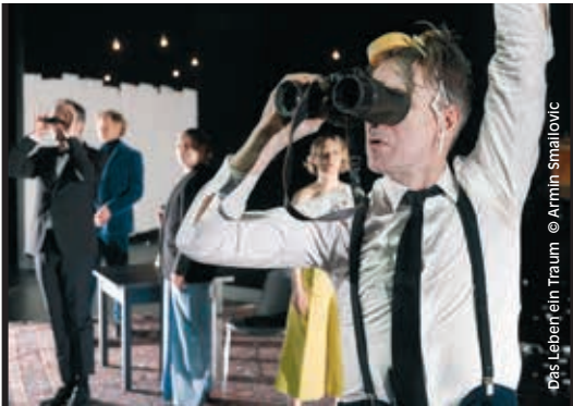
Das Leben ein Traum