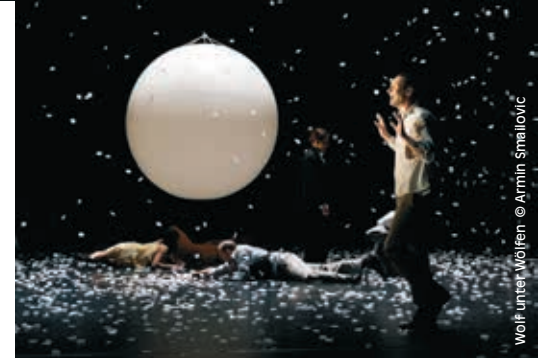
Wolf unter Wölfen