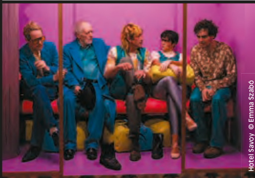
Hotel Savoy