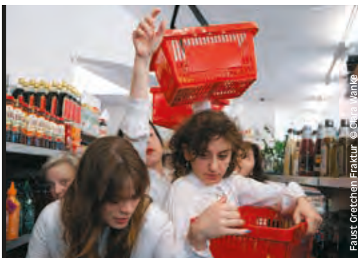
Faust Gretchen Fraktur

Der im Exil lebende russische Regisseur Kirill Serebrennikov bereitet derzeit seine vierte und letzte Thalia-Inszenierung vor. Nach „Der schwarze Mönch“, „Der Wij“ und „BAROCCO“ – allesamt Manifeste der Freiheit und Schönheit – wird er mit „LEGENDE“ im August die Ruhrtriennale eröffnen. Wir haben ihn nun überredet, vorab ein „Try-out“ für Hamburg zu ermöglichen. Vielleicht sehen Sie also allererste einen Rohbau der Inszenierung, vielleicht sehen Sie Ausschnitte – das wissen wir noch nicht. Was wir aber wissen: Sie haben die Möglichkeit, ganz dicht dran zu sein bei der Entstehung einer aufregenden Inszenierung, bevor sie eines der wichtigsten internationalen Festivals eröffnet und dann ab dem 30. November im Thalia Theater zu sehen ist.