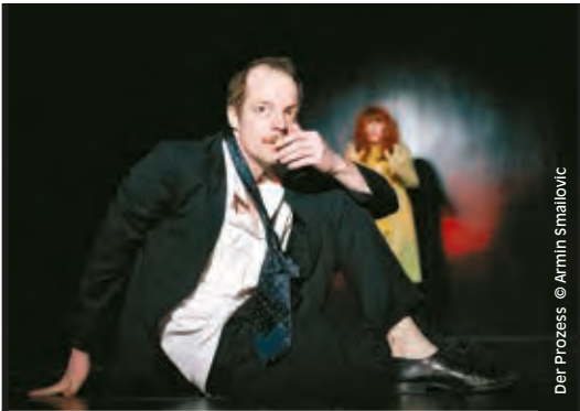
Der Prozess